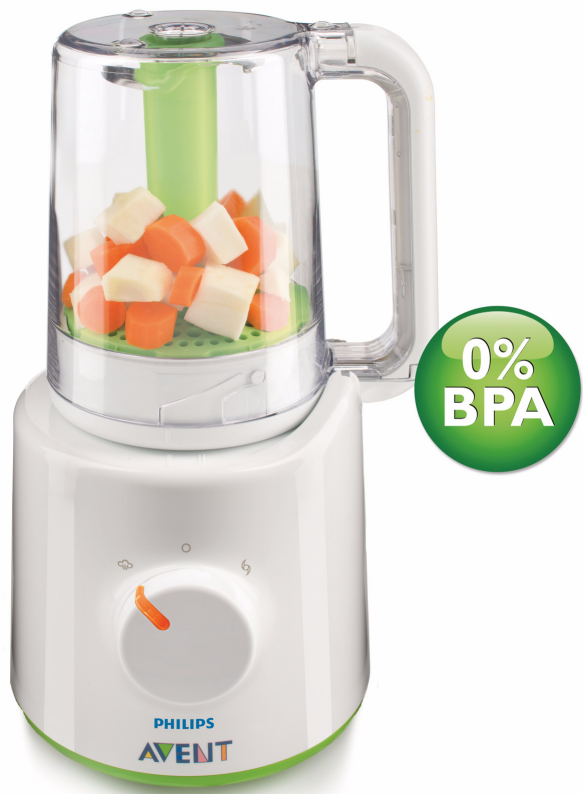
Philips AVENT Robot cuiseur vapeur et mixeur